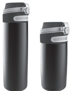
Flip 350 / 600 ml